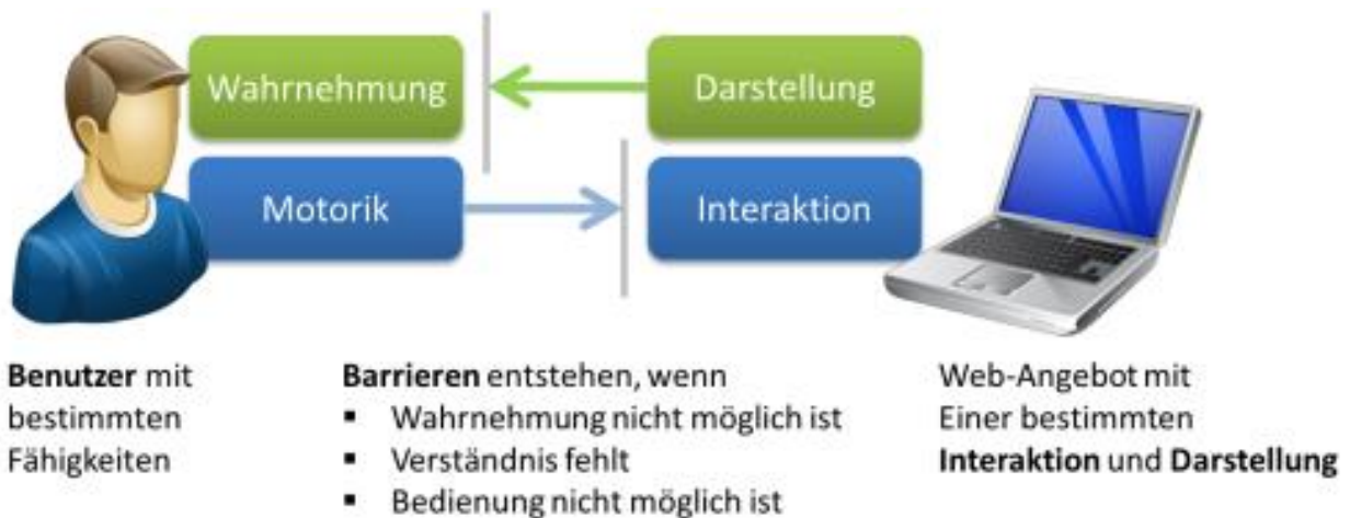
Abbildung 2: Digitale Wechselbeziehungen als Ursache von Barriere 4

Um die Vorgehensweise verstehen zu können ist es erforderlich zu verstehen, wo und wie diese Barrieren entstehen. Dies veranschaulicht die nachstehende Abbildung.