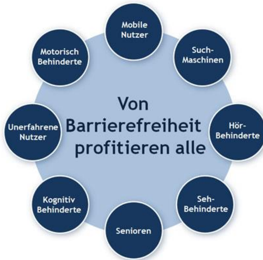
Abbildung 1: Wirkungskreis positiver Effekte der digitalen Barrierefreiheit 1