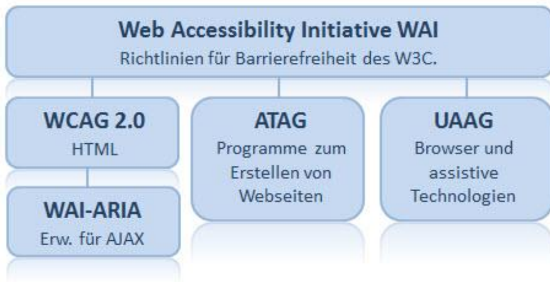
Abbildung 3: Wechselspiel WAI-Richtlinien 7

WCAG 2.0 wurde bereits angeführt. WAI-AIRI 8 ist eine Erweiterung der WAI zu Accessible Rich Internet Applications (kurz ARIA) und ist speziell für Websites mit dynamischen Inhalten entworfen worden, die beispielsweise mit AJAX (einer Programmiersprache) realisiert wurden. ATAG 9 steht für Authoring Tool Accessibility Guidelines und definiert die Richtlinien für Software mit der Webseiten erstellt werden (Authoring Tools – Autoren Werkzeuge). Daneben gibt es noch die User Agent Accessibility Guidelines 10 . Die UAAG definieren die Richtlinien für sogenannte User Agents, das sind beispielsweise Web-Browser, Media-Player oder die Eingangs erwähnten assistiven Technologien.