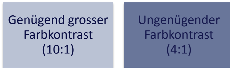
Abbildung 5: Schaukasten Farbkontraste

Auch beim Verwenden eines Hintergrundbildes sollten Sie auf diese Verhältnisse achten. Ebenfalls wichtig und zu bedenken ist, dass die Schrift auch bei ausgeschaltetem Hintergrund kontrastreich und somit gut sichtbar bleiben sollte.